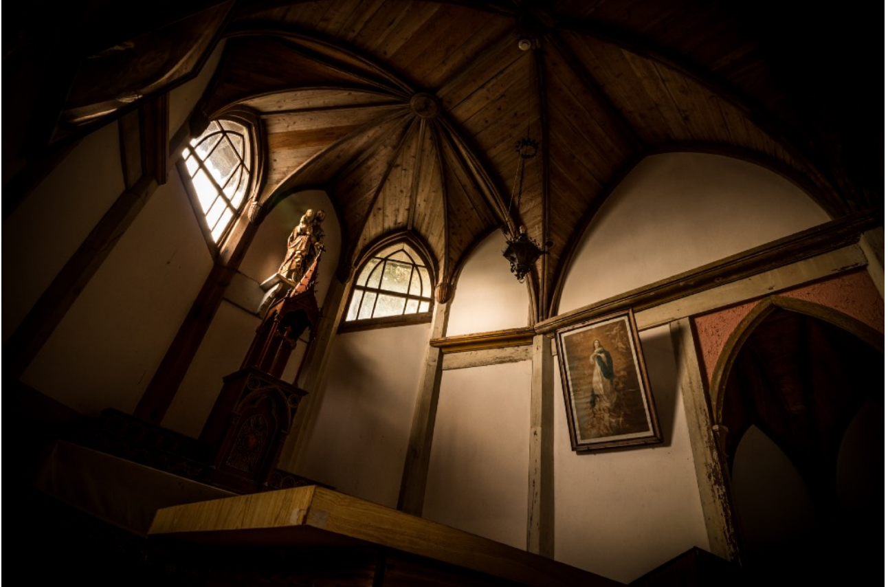
旧五輪教会堂