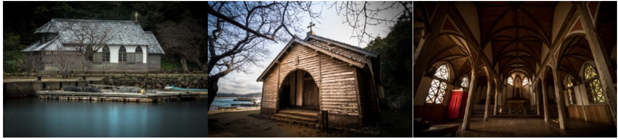
旧五輪教会堂